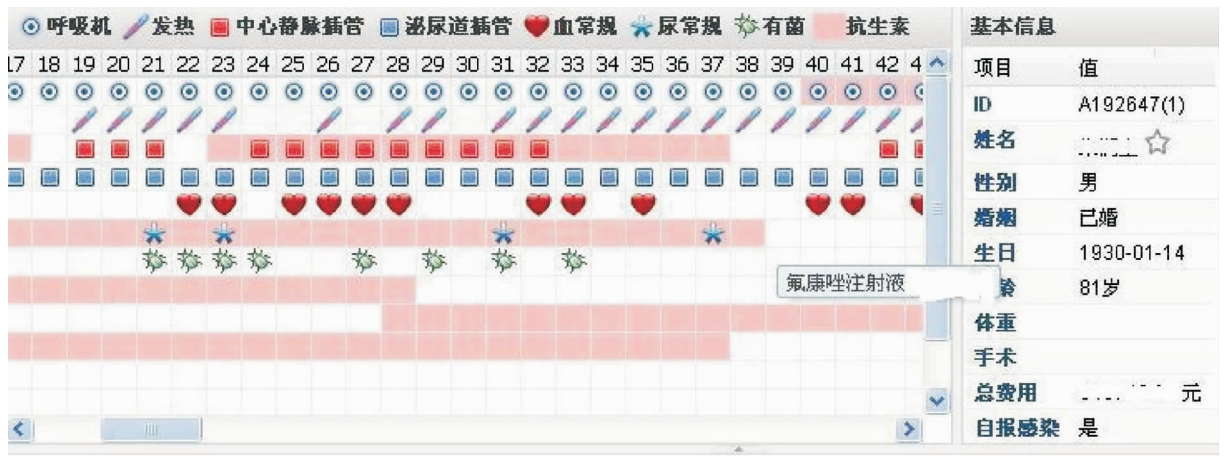
图 3 病例感染相关信息时序图

了然, 感染管理专职人员能对患者的感染病情迅速作出判断。如发热、病原菌、抗菌药物使用、呼吸机、尿管等侵入性操作, 分别以不同的图识标识出来, 以时间为横坐标绘制成时序图。将鼠标放在图识上可以显示具体信息, 如鼠标放在抗菌药物图标上, 会显示抗菌药物的具体名称。