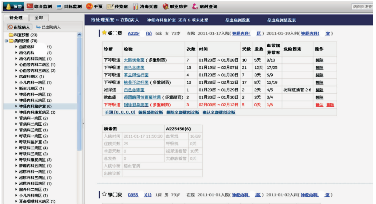
图 2 疑似感染病例个案预警展示图

产生疑似感染病例 30~40 例, 1 名感染管理专职人员处理时间只需 1~1.5 h。